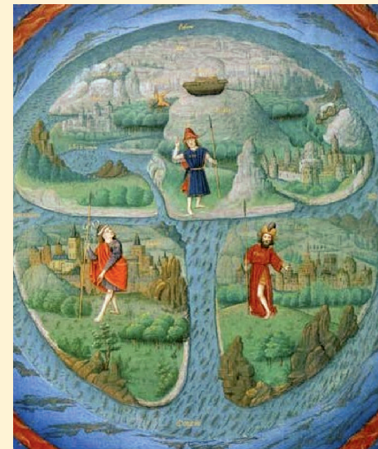
Jean Mansel. La fleur des Histoires , Brussels, Bibliothèque Royal. (ms. 9231, fol.281 v). Mapamundi. Ca. 1446-56